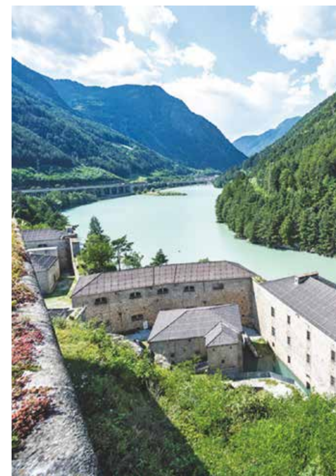
03 FESTUNG FRANZENSFESTE FORTE ASBURGICO DI FORTEZZA FRANZENSFESTE FORTRESS

Die uneinnehmbare Festung, benannt nach Kaiser Franz I. von Österreich, wurde 1833 – 38 errichtet und ist ein riesiges Labyrinth aus Räumen, Kasematten, Gängen und Treppen. Das logistische Meisterwerk war zu Beginn seiner Zeit das stärkste Festungswerk Europas, erlebte aber nie echtes Kampfeschehen.