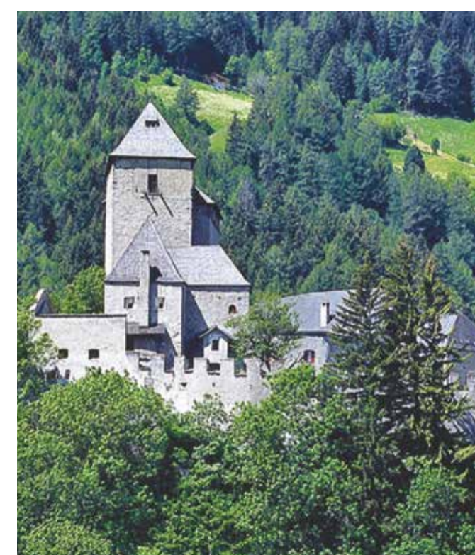
02 BURG REIFENSTEIN CASTEL TASSO REIFENSTEIN CASTLE

Route Pustertal Ciclabile Val Pusteria Bike Route Val Pusteria