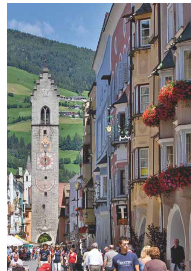
01 STERZING VIPITENO

Mittelalterliches Flair und moderner Charme – die Alt- und Neustadt der ehemaligen Bergwerksstadt mit dem markanten Zwölferturm am Stadtplatz laden ein zum Flanieren und Shoppen und zur Einkehr in Traditionswirtshäuser und Stadtcafés. Besonders sehenswert ist der gotische Ratssaal des Rathauses in der Neustadt, der mit seinem markanten Eckerker, dem einfachen Wandgetäfel und der Balkendecke als der schönste Tirols gilt. Im Innenhof zu besichtigen ein Mithrasstein und ein römischer Meilenstein.