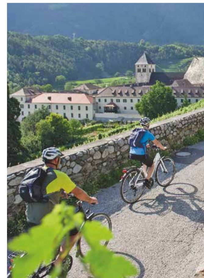
04 AUGUSTINER CHORHERRENSTIFT NEUSTIFT ABBAZIA DI NOVACELLA ABBEY OF THE AUGUSTINIAN CANONS REGULAR

Mit der Engelsburg, der spätbarocken Stiftskirche, dem gotischen Kreuzgang, dem Wunderbrunnen, der Bibliothek mit einzigartigen Handschriften und der historischen Pinakothek gehört die größte Klosteranlage Tirols zu den bemerkenswerten Sehenswürdigkeiten im Eisacktal. Eigene Stiftskellerei mit bekannten Weißweinen.