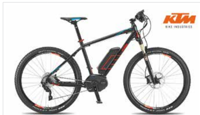
E-MTB Macina Race 27" Plus Reservierung | Prenotazione | Booking < 48 h