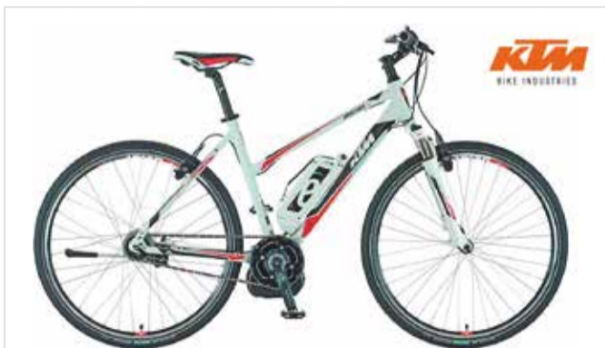
E-Bike Macina Cross 8-400 Unisex Reservierung | Prenotazione | Booking < 48 h