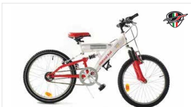
MTB 20" / 24" Nabenschaltung | cambio a mozzo | Hub gear