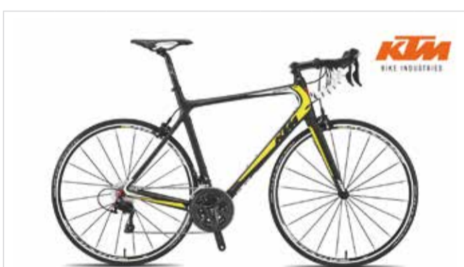
Revelator 3.500 Reservierung | Prenotazione | Booking < 48 h