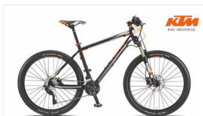
Top-MTB Ultra Sport 27" Shimano Deore XT Reservierung | Prenotazione | Booking < 48 h