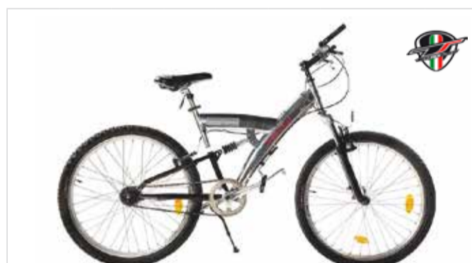
MTB 26" 7 Gang Nabenschaltung | cambio a mozzo | Hub gear