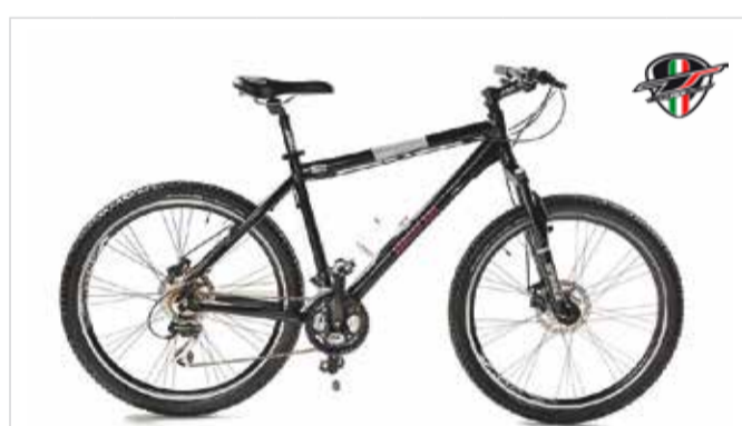
MTB 26" Shimano Acera 24 Reservierung | Prenotazione | Booking < 48 h