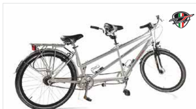
Tandem Nabenschaltung | cambio a mozzo | Hub gear