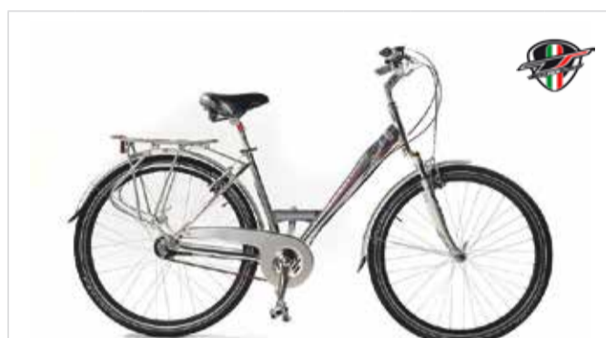
Trekkingbike Nabenschaltung | cambio a mozzo | Hub gear