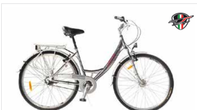
City Bike Nabenschaltung | cambio a mozzo | Hub gear