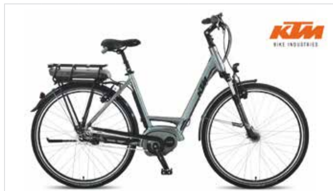
E-Bike Macina Eight 8-400 Tiefensteiger Reservierung | Prenotazione | Booking < 48 h